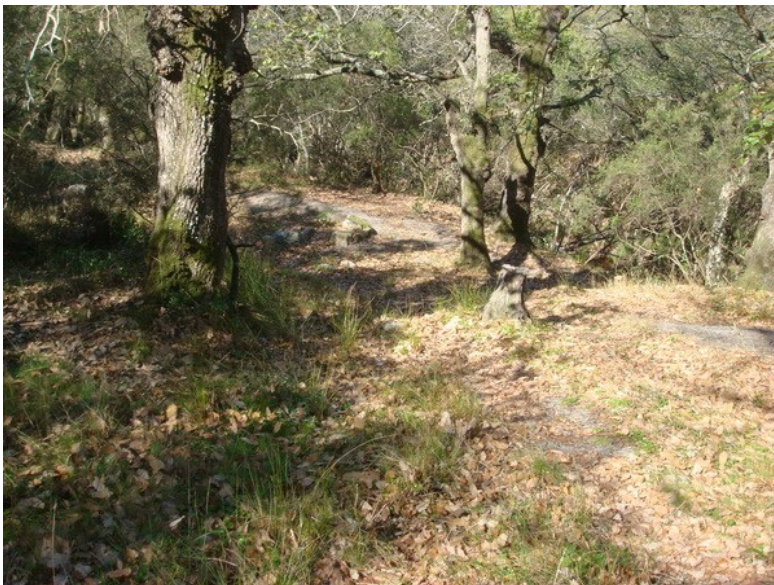
Figuras 8-9. El hábitat de Orthochaetes baeticus K. Daniel, 1906 en Los Barrios, bosque con Quercus.