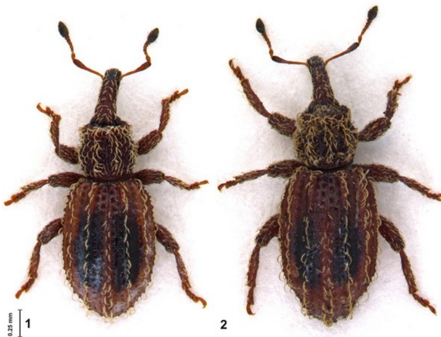
Figuras 1-2. Habitus de Orthochaetes baeticus K. Daniel, 1906, Los Barrios.

C. Germann et al. Nuevos registros de Orthochaetes baeticus K. Daniel, 1906, especie endémica de Cádiz España, características de la hembra y O. cerdanicus Hustache, 1930 especie válida (Coleoptera, Curculionidae)