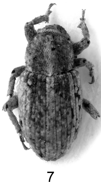
Fig. 7 - Tychius veridicus (paratypus ♀): habitus.