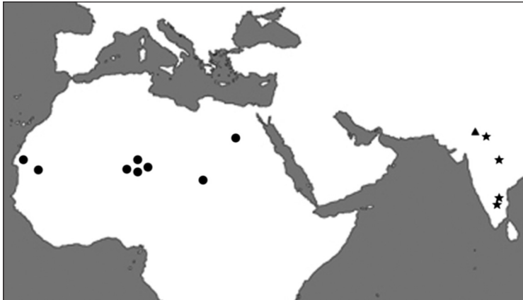
Fig. 8 - Località di cattura note per: Tychius heydeni Tournier (tondo); T. prope heydeni (triangolo); T. veridicus n. sp. (stella).

CONSIDERAZIONI E NOTE COMPARATIVE. Per le seppur lievi differenze esclusivamente nella lunghezza del rostro ho preferito non inserire nella serie tipica gli esemplari dell'India settentrionale e meridionale, considerando anche la notevole distanza delle località di cattura da quella tipica. La specie risulta molto simile a T. heydeni dal quale può essere così separato: